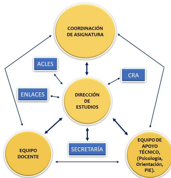
Figura N°3. Diagrama del Área Pedagógica.

Avenida Santa María 2140-Teléfono: (58) 2572312 Página web: www.colegiosanmarcosdearica.cl e-mail: colegio@fesma.cl