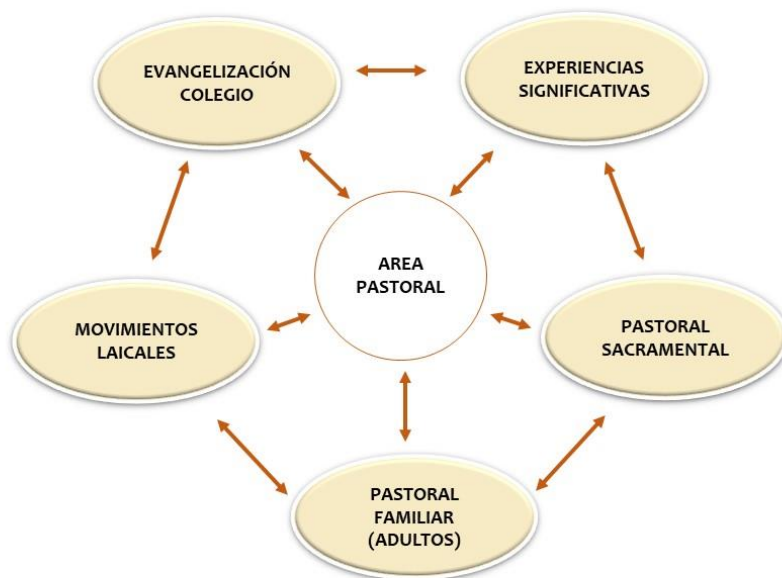
Figura N°2. Diagrama del Área de Gestión Pastoral.

Avenida Santa María 2140-Teléfono: (58) 2572312